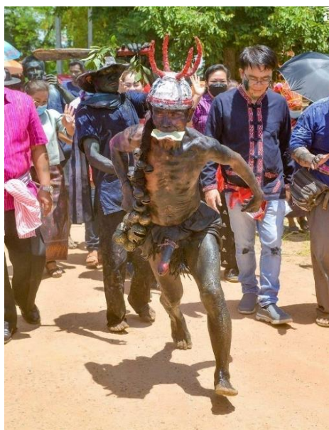
ภาพที่ 1 ควายหลวงใหญ่

5.1.2.2 ด้านการแต่งกาย การแต่งกายในงานบุญบวชควายหลวงจะแต่งกายตามบริบท หน้าที่และตามตำแหน่งของแต่ละบุคคลในคณะควายหลวง โดยการแต่งกายนี้เกิดจากการที่ชาวบ้าน ได้นำเครื่องแต่งกายที่มีอยู่ในชุมชนหรือที่สามารถผลิตได้เองในชุมชน เช่น เสื้อม่อฮ่อม กางขาก๊วย ผ้าขาวม้า ผ้าโสร่ง เป็นต้น มาประยุกต์ใช้ให้เข้าผู้ที่ได้รับมอบหมายให้ทำพิธีกรรมบวชควายหลวงอีก นัยยะ คือ การแต่งกายในลักษณะ ต่าง ๆ ที่แตกต่างกันสามารถทำให้แยกตำแหน่งหน้าที่ได้อย่าง ชัดเจนว่าบุคคลท่านใด ทำหน้าที่อะไรในการประกอบพิธีกรรมบุญบวชควายหลวง ซึ่งประกอบไปด้วย การแต่งกายของควายหลวงใหญ่และควายหลวงน้อย, การแต่งกายของตุลาการบ้าน, การแต่งกาย หัวหน้าควายหลวง, การแต่งกายของแม่ นางหว่า, การแต่งกายผู้ชักมวย และการแต่งกายของผู้แบก เสลียงอัญเชิญเจ้าพ่อโฮงแดง ซึ่งการแต่งกายทั้งหมดจะนิยมทาหน้าและตัวด้วยสีผสมอาหารสีดำและ ควายหลวงจะมีการทาลิปสติกสีแดงที่บริเวณตา