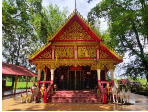
ภาพที่ 5 ศาลเจ้าพ่อโฮงแดง ณ บ้านแมต อำเภอยางชุมน้อย จังหวัดศรีสะเกษ

5.1.2.6 รูปแบบขบวน การจัดรูปแบบของการจัดขบวนในพิธีกรรมบวชควาย หลวงนั้น มีรูปแบบการจัดที่เป็นเอกลักษณ์ โดยนำเสนอผ่านกระบวนการจัดรูปแบบแถวประเภทแถว ตอนลึก โดยมีลักษณะของรูปแบบขบวนแห่ ซึ่งผู้ปฏิบัติหน้าที่ต่าง ๆ ในคณะควายหลวงจะเป็นส่วน หนึ่งในขบวน โดยเริ่มจากการจัดตั้งขบวนแห่ สามารถแบ่งรูปแบบจัดตามตำแหน่งการยืนในขบวนได้ ดังนี้ ตำแหน่งที่ 1 เป็นสัญลักษณ์แทนควายหลวง ซึ่งเป็นผู้นำคนแรกของขบวนแห่, ตำแหน่งที่ 2 เป็น สัญลักษณ์แทนหัวหน้าคณะควายหลวง, ตำแหน่งที่ 3 เป็นสัญลักษณ์แทนอุปฌาย์บวชควายหลวง, ตำแหน่งที่ 4 เป็นสัญลักษณ์แทนเสลี่ยงเจ้าพ่อโฮงแดง, ตำแหน่งที่ 5 เป็นสัญลักษณ์แทนแม่ นางหว่า, ตำแหน่งที่ 6 เป็นสัญลักษณ์แทนนักดนตรี ซึ่งรูปแบบการจัดขบวนแห่สามารถวิเคราะห์รูปแบบขบวนได้ ดังภาพที่ 6