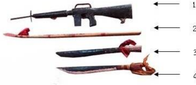
ภาพที่ 3 ศาสตราวุธ

ไฟ จำนวน 3 บั้ง และนำไปจุดถวายทั้ง 3 บั้งประกอบกับการทำพิธีกรรมงานบุญบวชควายหลวงเพื่อความเป็นสิริมงคล