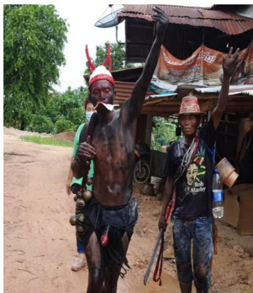
ภาพที่ 2 ควายหลวงตัวสำรอง

5.1.2.3 ด้านอุปกรณ์ที่ใช้ในงานบุญบวชควายหลวง อุปกรณ์ที่ใช้ในการประกอบใน พิธีกรรมงานบุญบวชควายหลวง สามารถแบ่งได้ 4 ประเภท คือ 1. เครื่องบูชา (ขันธ 5) ประกอบไป ด้วย ดอกไม้ขาว 5 คู่ , เทียน 5 คู่ , ธูป 5 คู่, คำหมาก 4 คำ, ยาสูบใบตอง 4 มวน 2. เครื่องศาสตรา รุช ประกอบไปด้วย มีด ดาบ หอก และ ปืน 3. เครื่องใช้พร้อมเสลียงอัญเชิญเจ้าพ่อโฮงแดง ประกอบ ไปด้วย เสลียง 1 อัน, หมอนสามเหลี่ยมหรือหมอนขิด จำนวน 1 ใบ, กาทมน้ำ 1 อัน, จานที่ใช้รอง เครื่องบูชา, รมสีดำ 1 คัน โดยกางรมไว้บนเสลียง, ลองเท้าตะ 1 คู่ และ 4. เครื่องเสียงทาย คือ บั้ง