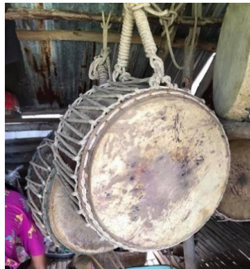
ภาพที่ 4 กลองรำมะนาอีสาน ที่มา : ผู้วิจัย

5.1.2.4 ด้านดนตรีที่ใช้ประกอบในงานบุญบวชควายหลวง ดนตรีที่ใช้ในงานบุญบวชควายหลวงใช้ดนตรีพื้นบ้านของชาวอีสานมีทั้งหมด 2 ชิ้น ได้แก่ กลองรำมะนา เป็นเครื่องกำกับจังหวะที่ซึงด้วยหนัง หุ่นกลองทำด้วยไม้ขนุนหรือไม้เนื้อแข็ง เช่น ก้ามปู หนังกลองใช้หนังวัวซึงด้วยเชือกไผ่ล่อนทำหน้าที่ดำเนินจังหวะในวงดนตรีพื้นบ้าน ขณะตีนิยมใช้มือเดียวตีเป็นเสียง “ปะ” ใช้ฝ่ามือตีลงบนหน้ากลองพร้อมกับกดไว้ตีเสียง “ตุ้ม” และฉาบ เป็นเครื่องประกอบจังหวะที่ทำด้วยโลหะ การจับฉาบมีลักษณะคือ มือขวาใช้หัวแม่มือและนิ้วชี้จับเชือกตรงส่วนที่ติดกับฉาบ มือซ้ายจับเหมือนมือขวา แต่อยู่ในลักษณะกำมือให้ฉาบวางบนมือซ้าย การตีให้หางฉาบมือซ้ายขึ้นและคว่ำมือขวาลง ตีประกบกันให้ฉาบเกิดการสั่นสะเทือน ซึ่งนักดนตรีทุกคนในคณะสามารถเล่นเครื่องดนตรีสลับกันได้