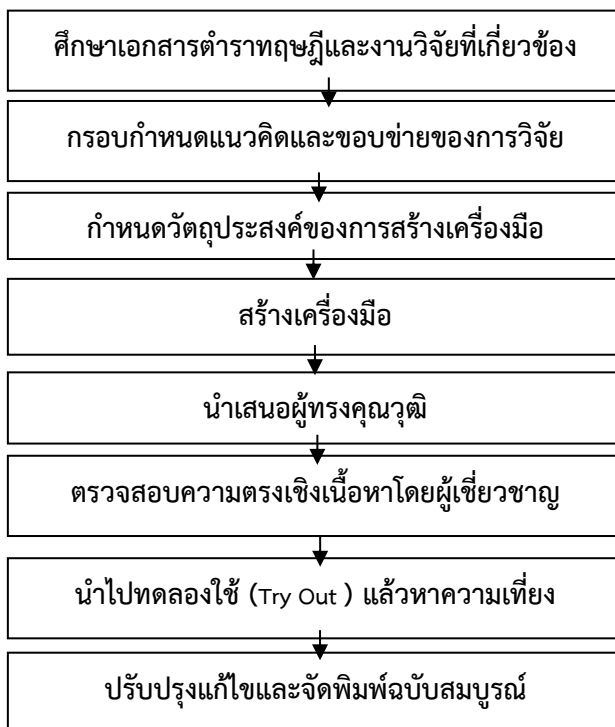
ภาพประกอบที่ 1.1 แสดงขั้นตอนการสร้างเครื่องมือที่ใช้ในการวิจัย

7) จัดพิมพ์เครื่องมือแบบสอบถามฉบับสมบูรณ์แล้วนำไปเก็บข้อมูลในการวิจัยโดยมีขั้นตอนการสร้างเครื่องมือเป็นไปตามภาพประกอบที่ 1.1 ดังนี้